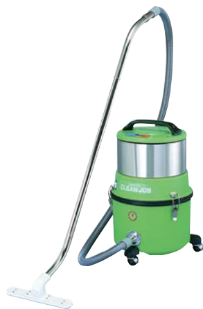
クリーンルーム用掃除機 1kW (品番S-CLS10)