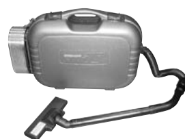
クリーンルーム用掃除機 500W