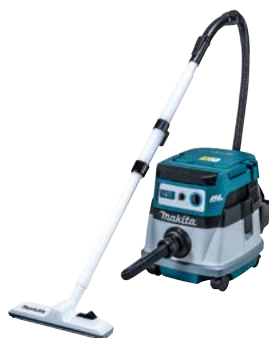
バキュームクリーナー充電式 (品番：S-VCJ)