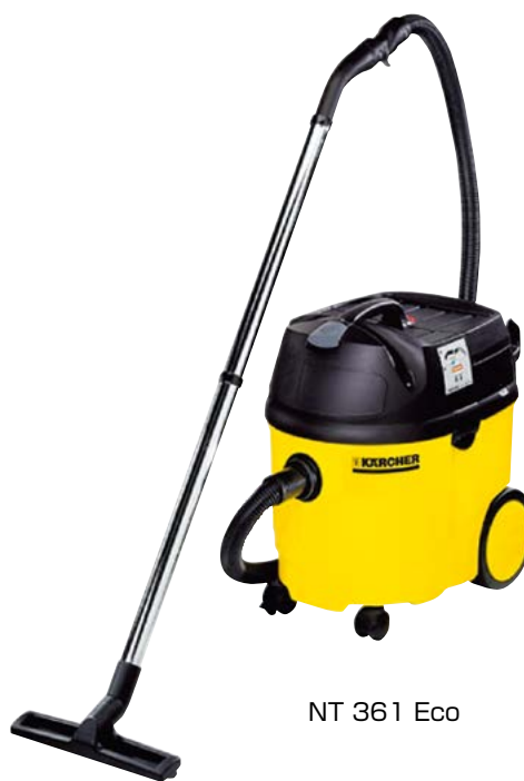
NT 361 Eco