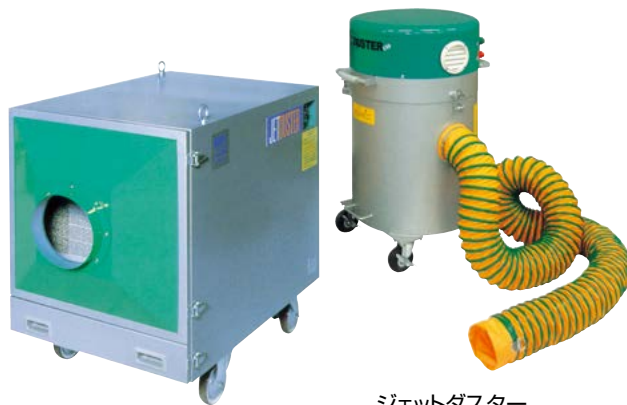
ジェットダスター EJD5